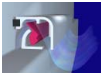
Ihr GEALAN-Partner berät Sie gern:

In Normalstellung steht die Klappe offen – Luft kann ungehindert zirkulieren und so der Bildung von Schimmelpilz vorbeugen.